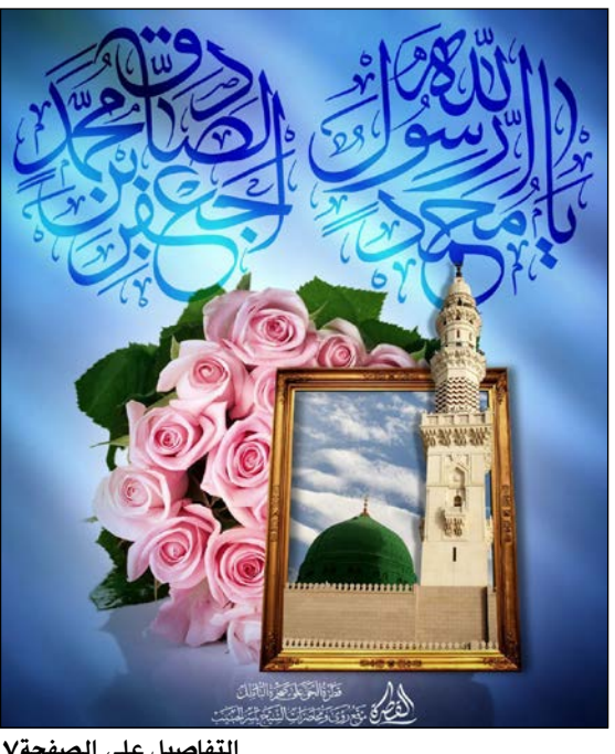
التفاصيل على الصفحة ٧

في ١٧ ربيع الاول: ذكرى ولادة النورين الرسول الاكرم محمد (ص) والامام الصادق (ع)