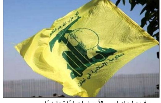
وشهد لبنان امس الأربعاء، إضراباً تضامنياً في القطاعين التربوي والعمالي، تنديداً بالعدوان الصهيوني الفاشم على لبنان، والذي راح ضحيته ١١ شهيداً وأكثر من ٤٠٠٠ جريح. وأعلن وزير التربية والتعليم العالي عباس

الحلبي، إقفال المدارس والثانويات والمعاهد الفنية الرسمية والخاصة، والجامعة اللبنانية ومؤسسات التعليم العالي الخاصة كافة، امس الأربعاء ووقف الأعمال الإدارية والتضريبية في المدارس والثانويات والمعاهد الفنية الرسمية والخاصة، وذلك استنكاراً للعمل الإجرامي الذي اقترفته العدو «الاسرائيلي» بحق المواطنين والذي أوقع شهداء وجرى بالآلاف. وقدم الوزير الحلبي الى أهالي الشهداء أحر التعازي معبراً عن عميق حزنه وتأثره داخلياً للجرى بالشهداء العاجل ويسلمة جرحهم.